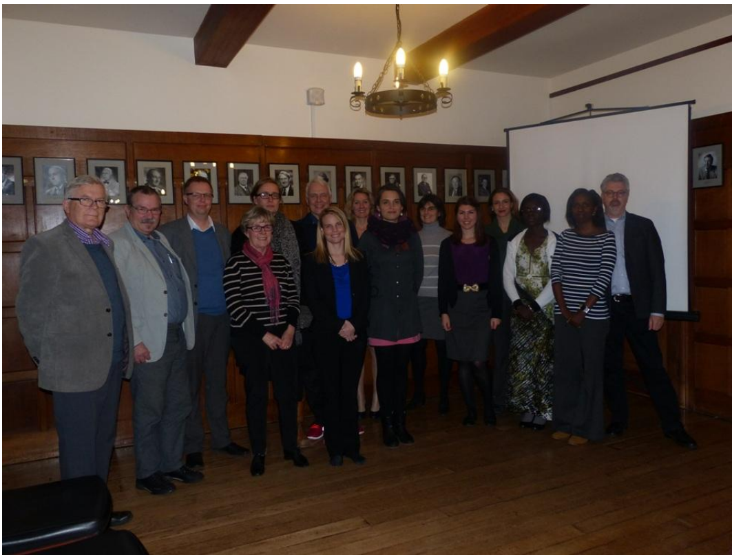
Picture: Workshop “Their crime is being born – Children Born of war in the 20th century” Wolfson College, Cambridge, UK, December 13-14 2013.